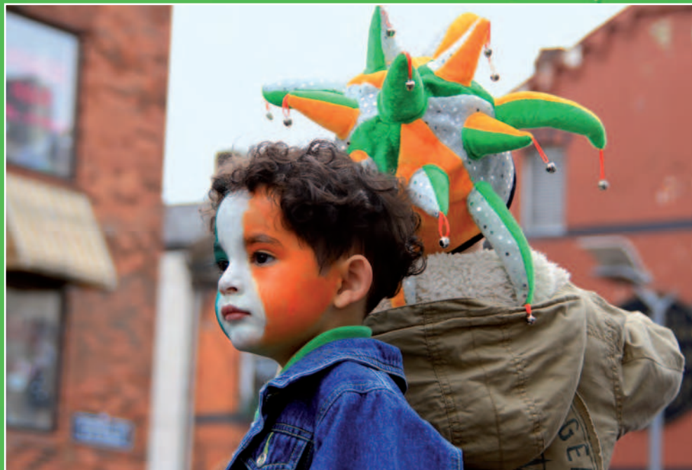
Die Strassen der irischen Hauptstadt sind jeweils Mitte März ein grosses, farbenfrohes Tollhaus.

Man darf sich aber das Festival nicht als geografisch in sich geschlossenen Event vorstellen. Die ganze Stadt ist im «grünen Fieber», wer grün angezogen ist, erhält hier und dort Rabatte auf Eintritte oder ein Pint Guinness, ja selbst der Dublin Zoo hält spezielle St. Patrick's Day Dekorationen bereit – immerhin geht es nicht so weit, dass Tiere grün angemalt werden. Oft gibt es auch spezielle Sportanlässe; 2012 wird